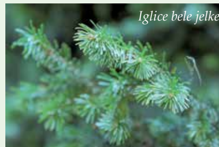
Igljice bele jelke

Pri številnih narodih je bila simbol plodnosti in dolgoživosti, zato se je ohranilo okraševanje jelke ob zimskem sončnem obratu. Poljaki, denimo, so včasih molzli mleko skozi jelkine vejice, da se ni pokvarilo; uporabljali so jih kot konzervans za živila. V Rusiji so imeli poročne vence iz jelkinih vejic za dolgoživost in plodnost – da bosta mladoporočenca imela veliko otrok. Pisni viri navajajo, da so naši predniki iz vej in lesa pripravljali zdravilne čaje in napitke. Na vsem področju Evrope, kjer je rasla jelka, je imela nekakšen primat. Slovenski znanstveniki pa so odkrili in potrdili, da čišlanje jelke pri naših prednikih nikakor ni naključno.